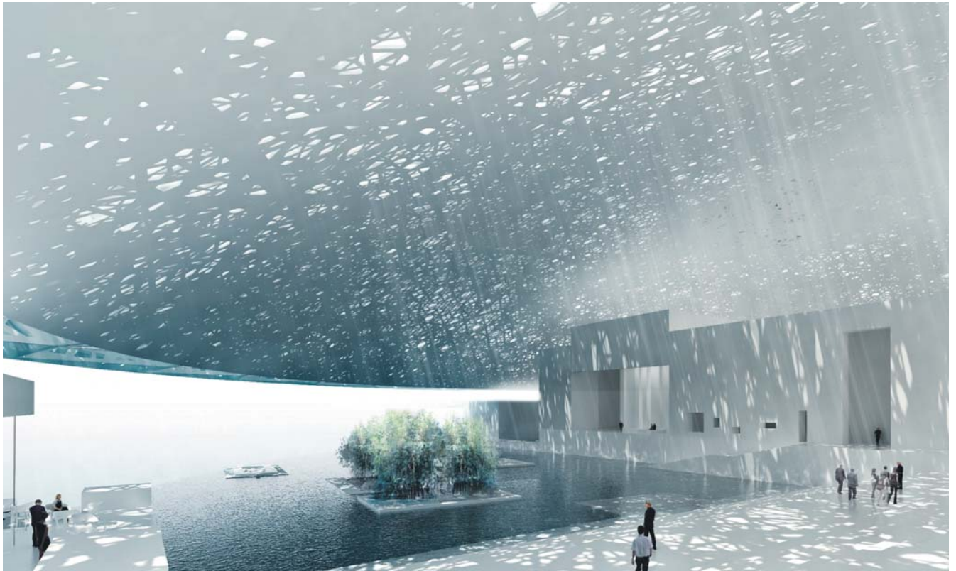
Het nieuwe Louvre in Abu Dhabi (oplevering in 2012/2013). Ateliers Jean Nouvel.

dit soort luxeproblemen kan bezighouden. De auteur preekt voor een publiek dat al tot hem bekeerd was.