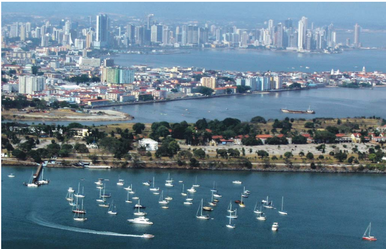
Skylines van Panama City (2005).

Twerp als een van die vitale kernzones, zeg maar de Benelux met een aantal uitlopers. Interessanter en relevanter dan die speculatieve cartografie is deel drie van het boek. Daarin gaat Florida op zoek naar 'de geografie van het geluk'.