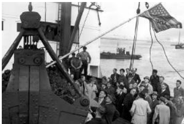
1948: Kolen van het Marshallplan arriveren in Amsterdam.