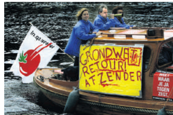
2005: De SP voert campagne tegen de Europese grondwet.